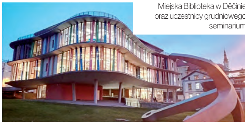
Miejska Biblioteka w Děčínie oraz uczestnicy grudniowego seminarium