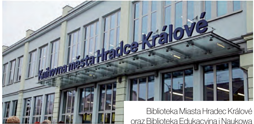
Biblioteka Miasta Hradec Králové oraz Biblioteka Edukacyjna i Naukowa w Hradcu Králové

Jak widać, biblioteki, które wybraliśmy za cel naszej podró-